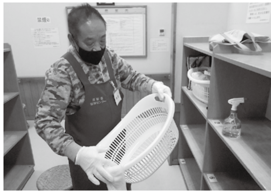
↑脱衣カゴの消毒作業

食堂、カラオケ等の利用が停止になり、その面での業務はなくなったのですが、コロナ禍後は、消毒作業がメイン業務となりました。受付での入館者の手指消毒、入浴者の脱衣カゴ消毒等、施設のすべての消毒を定期的に実施しています。