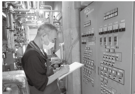
↑機械室での点検作業

運転し四十二度まで加熱する仕事です。また、営業が終わった後は二つのお風呂を自動洗浄してから水を抜いて空にする仕事もあります。