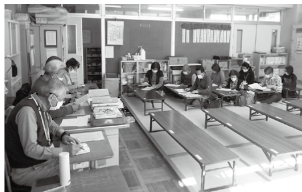
↑ミーティングの様子

その他にも、学童の利用申請書の内容確認や保護者からの負担金の受領などの事務のほか、センターと保護者の中継ぎのようなことも行っています。