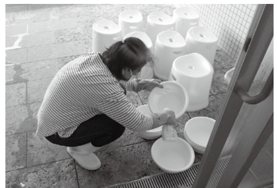
↑風呂場内での清掃作業

男性、女性会員の共通の仕事として、シャンプーの補充、布巾の洗濯、館内の清掃等の仕事があり、協調性は大切にするよう心掛けています。