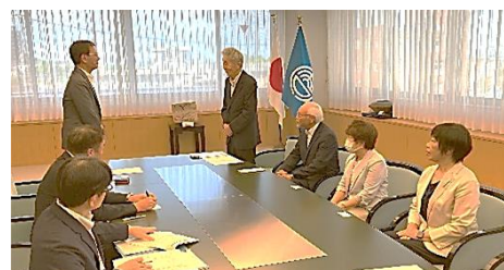
副議長へ提出しました。