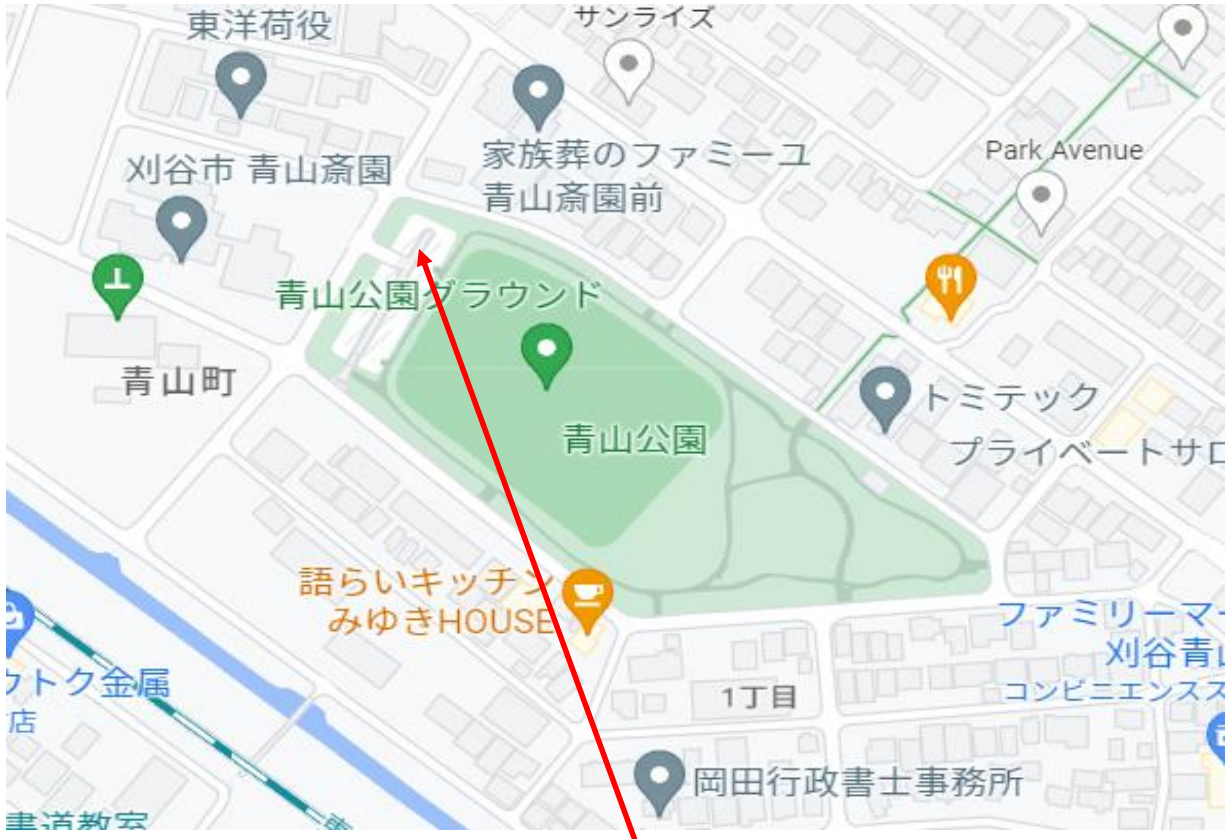
青山公園グラウンドP