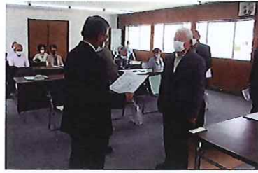
永年在職会員表彰式

総会に於いて、永年の功績を称えて該当の方々に表彰状及び記念品が授与されました。表彰を受けられた皆様は次の方々です。おめでとうございます。今後も健康に留意され、ますますご活躍されることをご祈念申し上げます。