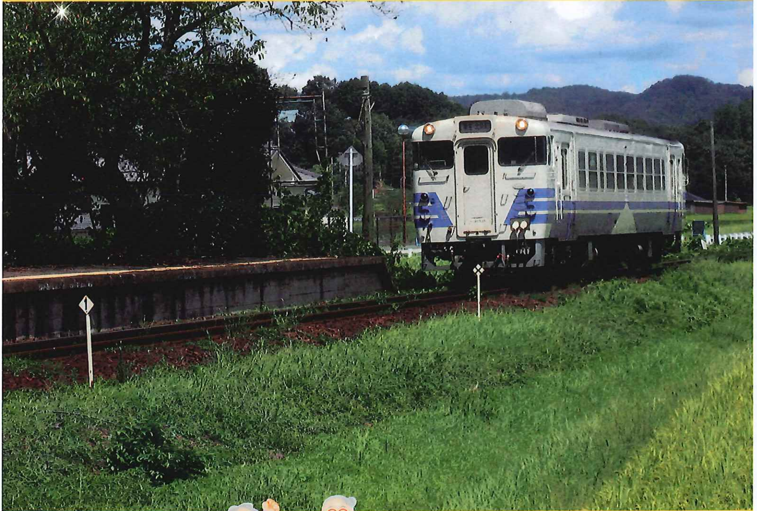
キハ40 気動車 (北条鉄道)