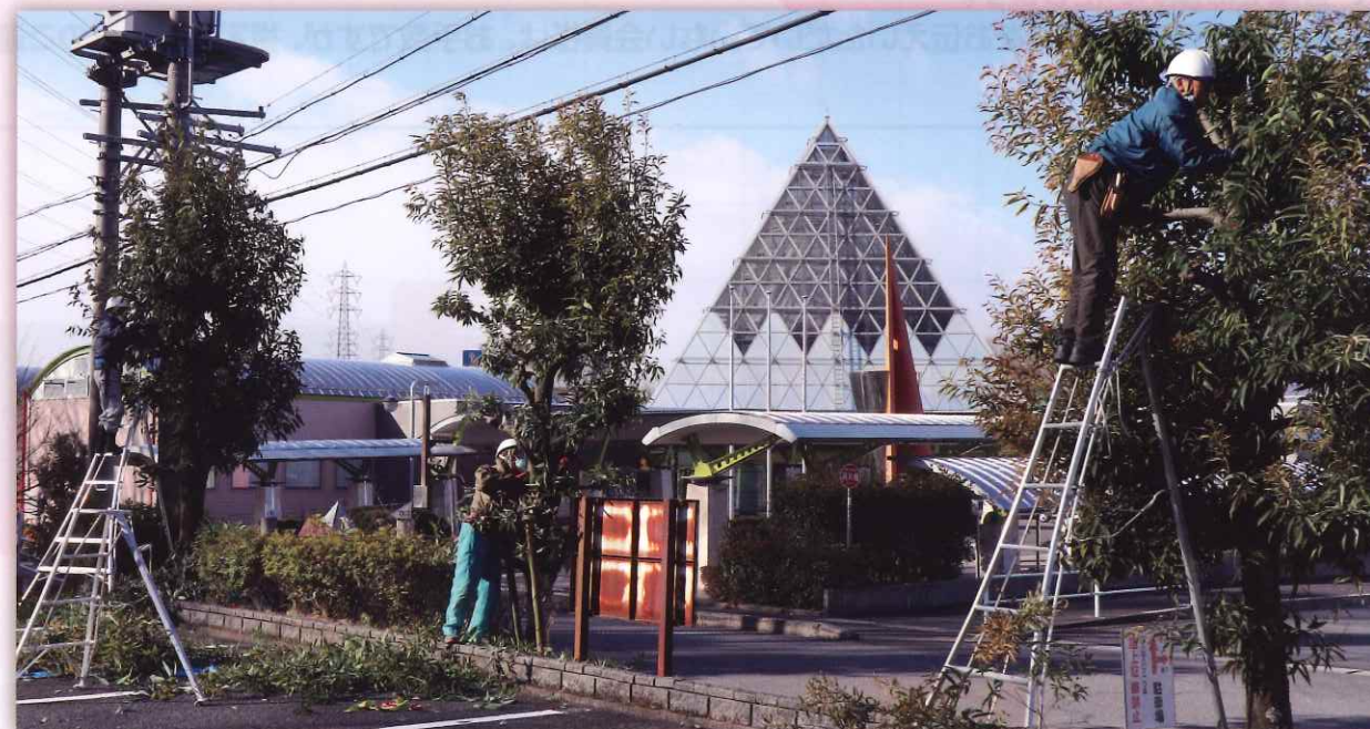
令和4年2月21日 剪定講習会