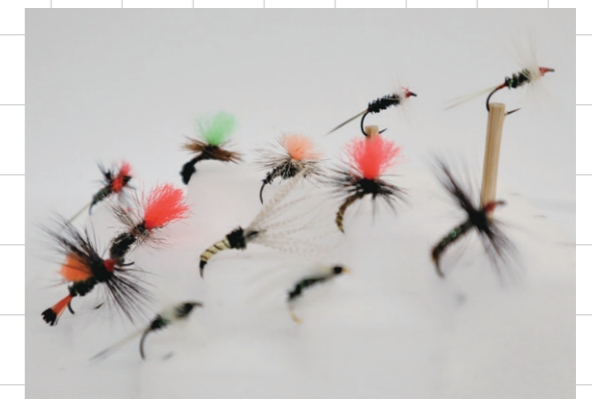
溪流釣り用の疑似餌