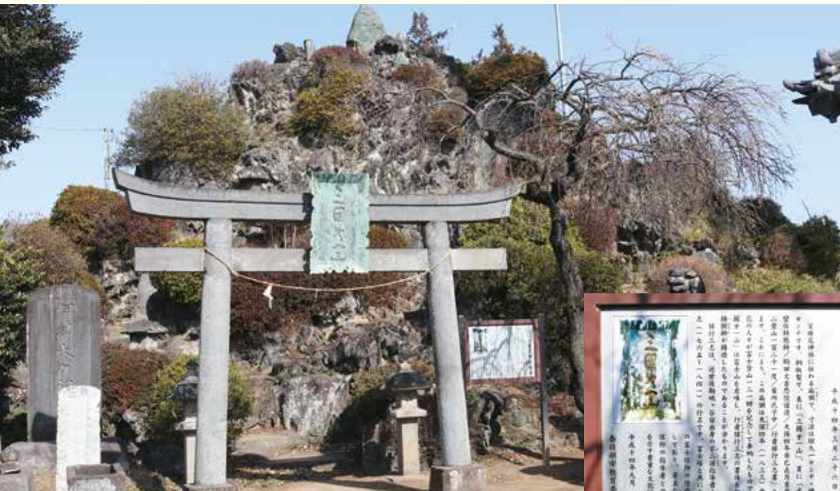
春日部市指定有形文化財宝珠花神社扁額と富士塚