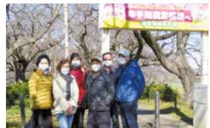
3月26日実施の屋外イベント「幸手・権現堂公園」の下見の時の写真です。