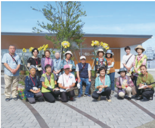
《天候 快晴 参加者17名》

⑤の笠原小学校は町に古くからある農村住宅がモチーフ。「学校はまち」「教室はすまい」「学校は思い出」の3つのコンセプトをもとに造られた赤い外壁と瓦屋根のユニークな学校。