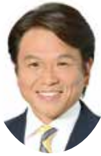
春日部市長 岩谷一弘

結びに、皆様のご健康とご多幸をお祈り申し上げます。新年のご挨拶とさせていただきます。