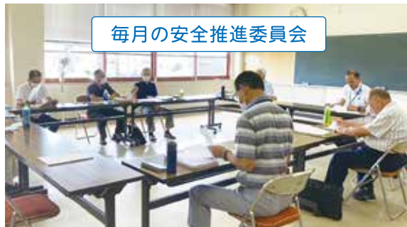
毎月の安全推進委員会

事故が多発した現場を集中的に巡回し、現場との意見交換、問題点抽出、再発防止を推進 (令和4年度は学校事故ゼロ巡回を実施)