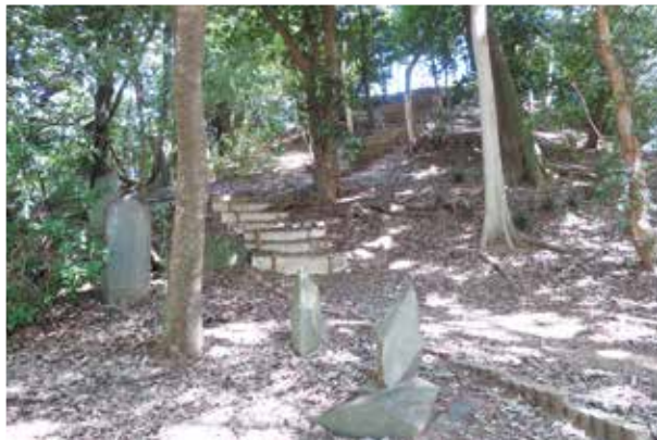
浜川戸浅間社 (高さ:12.225m) の富士塚

頂上には「浅間大神」の富士講碑や鳥居が有り、7基の合目石の所在が確認されており、中腹には「小御岳神社」などの富士講碑、麓には標石や鳥居、手水石などが有る。 (春日部市富士塚基礎資料参考)