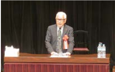
(福)春日部市社会福祉協議会 会長 挨拶