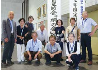
会員互助会桐の会役員名簿