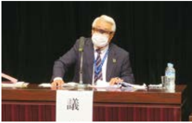
(公社)春日部市シルバー人材センター 理事長 挨拶