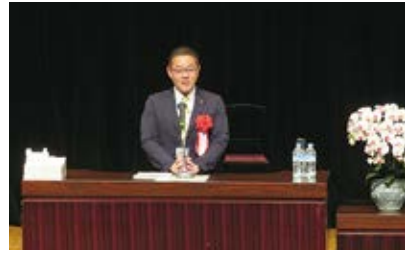
春日部市議会議長 挨拶