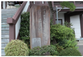
東陽時(曾良日記から)

一つは小淵山観音院。「ものいへば唇寒し 秋の風」の芭蕉句碑があります。芭蕉がどこに泊まったのか、今だにミステリーです。