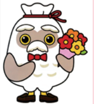
「チエブクロー」 シルバー人材センター イメージキャラクター