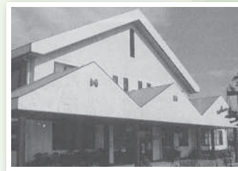
設立当時の「さんあいセンター」