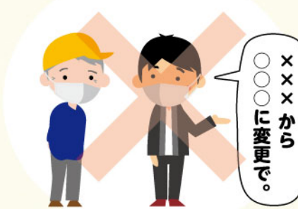
シルバー作業員 発注者様