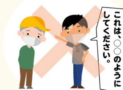
シルバー作業員 発注者様