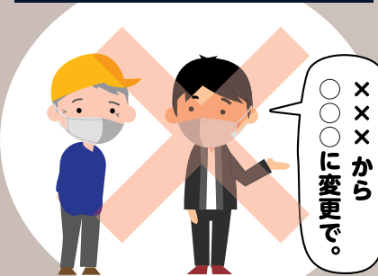
シルバー作業員 発注者様