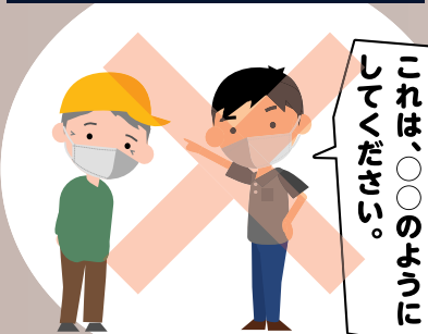
シルバー作業員 発注者様