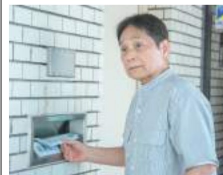
▲ 就業中の広報配布員さん =7日 就業風景

朝6時、1日が元氣よく始まる。まずは広報紙約800部を受け取り、自宅へ運ぶところからスタート。かつしか広報や各種印刷物を、配布しやすい大きさに丁寧に折り込み、ポストインの準備を進める。担当エリアは3つのブロックに分かれており、約3〜4時間かけて一軒一軒配布していく。「集中して取り組むので、終わった時の達成感が気持ちいいんです」と笑顔を見せる。仕事を始めて半年。まだ慣れないこともあるが、配布中に「ありがと」と声をかけられることが、大きな励みになっているという。「これからは汗だくになりそうですが、熱中症対策をして頑張ります!」と話し、次の季節にも前向きな表情を見せていた。