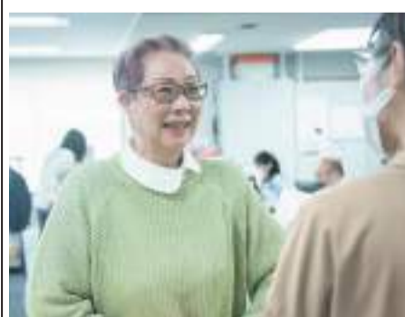
▲ 最高の笑顔をみせる施設管理さん =7日 就業風景

「清潔で気持ちよく利用できる場所になりたい。それが一番ですね」と明るく話す。施設には、子育て中の親子から高齢者まで幅広い世代が訪れる。日頃からチームで取り組む清掃は、「ここが一番きれい」と来館者から評判になっているという。施設管理の仕事は予約管理や清掃、来館者対応など多岐にわたる。以前の職場で培ったパソコンスキルを活かし、古くなったチラシを作成しなおすなど、「自分でできること」を積極的に取り組んでいる。「80代、90代の方が生き生きと施設を利用されている姿を見ると、私自身も元気をもらえるんです!」そう笑顔で話す姿からは、利用者への温かみを感じることが伝わってきた。