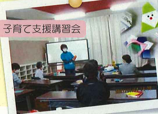
子育て支援講習会