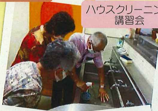
ハウスクリーニング講習会