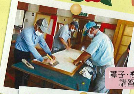
障子・襖張り講習会