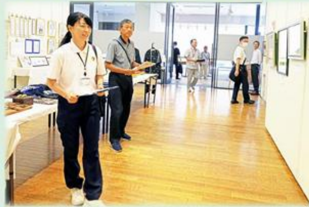
*川越市長の森田様がお来館されました。