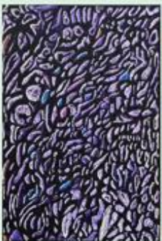
■「Repetitio」長瀬 淳 (レパティティオ～無数の～)