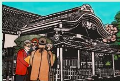
切り絵「ガイドの思い出」鈴木 登喜夫