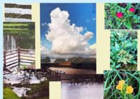
■「小群水鳥の郷 夏の八景」小林 一英