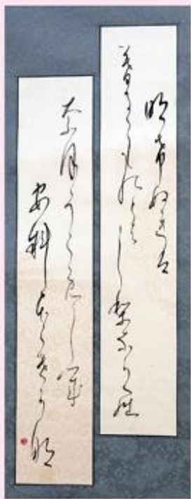
■「藤原道長の和歌」石川 信江