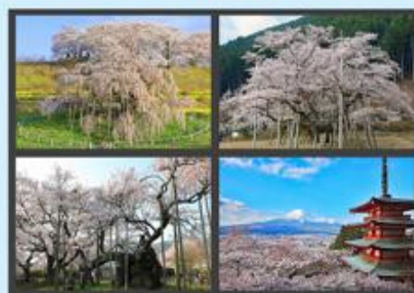
■「日本三大桜 他」忽滑谷 清