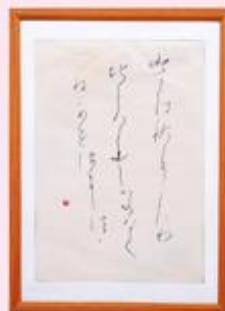
■「古今和歌集」鈴木 照夫