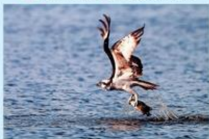
■「ミサゴの狩り」末次 豊