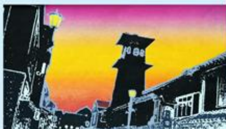
写真版画「川越時の鐘」山本 紀之