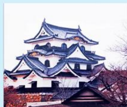
■「彦根城天守」宇津木 優