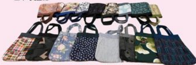
■「おしゃれなバッグ」十若会(16名)