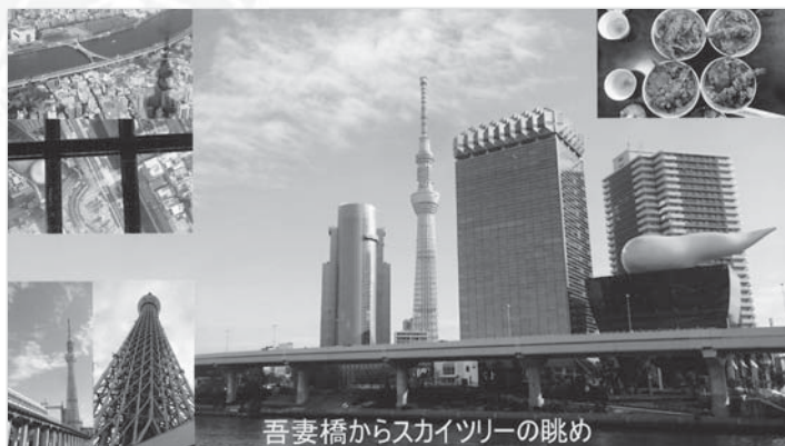
吾妻橋からスカイツリーの眺め