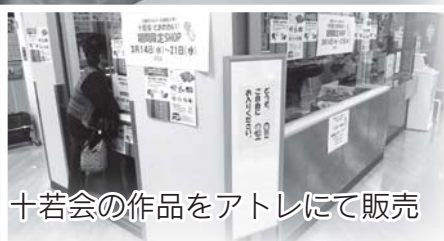
十若会の作品をアトレにて販売