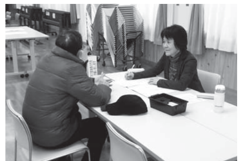
出張就業相談会の個別相談

地域密着型出張相談会で得られた皆様のご意見を基に、更なる就業機会の拡大や就業対策に反映させていただきます。