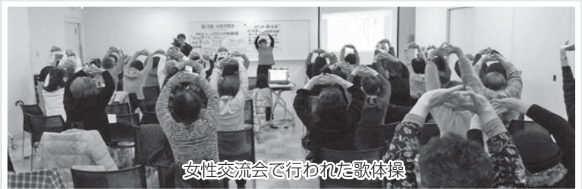
女性交流会で行われた歌体操