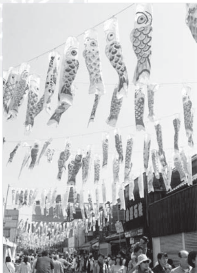
大正浪漫夢通り 鯉の季節

いにしへの通ひ舟路に今年また 忘ることなく桜さき添ふ いづかさの寺にみどりの桜花 問ふも気高く匂ふばかりに