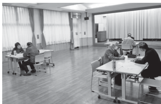
大東南公民館で開催された出張就業相談会

地域密着型出張相談会で得られた皆様のご意見を基に、更なる就業機会の拡大や就業対策に反映させていただきます。