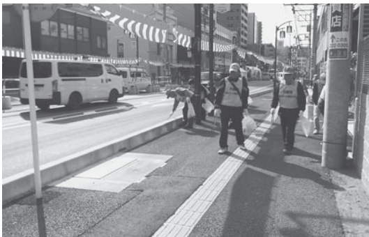
清掃ボランティア

そして、ご苦勞様ですとねぎらいの言葉もいただきありがとうございます。これ以上嬉しいことはありません。活動に参加していただいた皆様に深く感謝いたします。来年も大勢の皆さんの参加をお待ちしています。(広報委員会 佐々木)