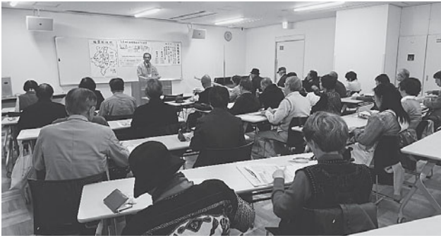
ウエスタ川越での出張入会説明会