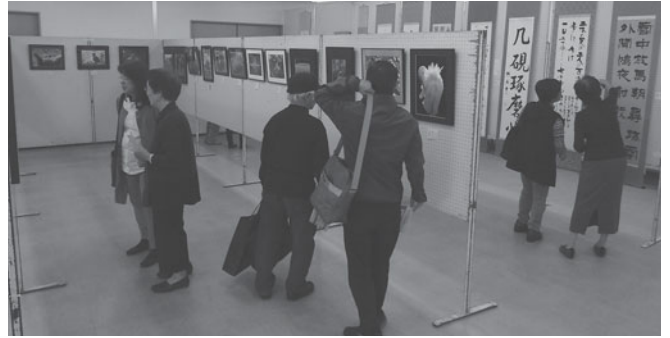
シルバーふれあいまつりの会員作品展