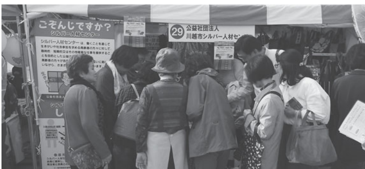
ウエスタ川越での産業フェスタ