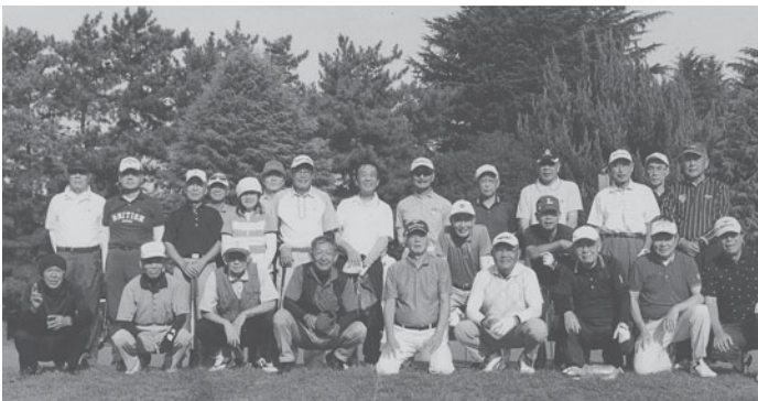
第60回記念ゴルフコンペ (熊谷ゴルフクラブにて)