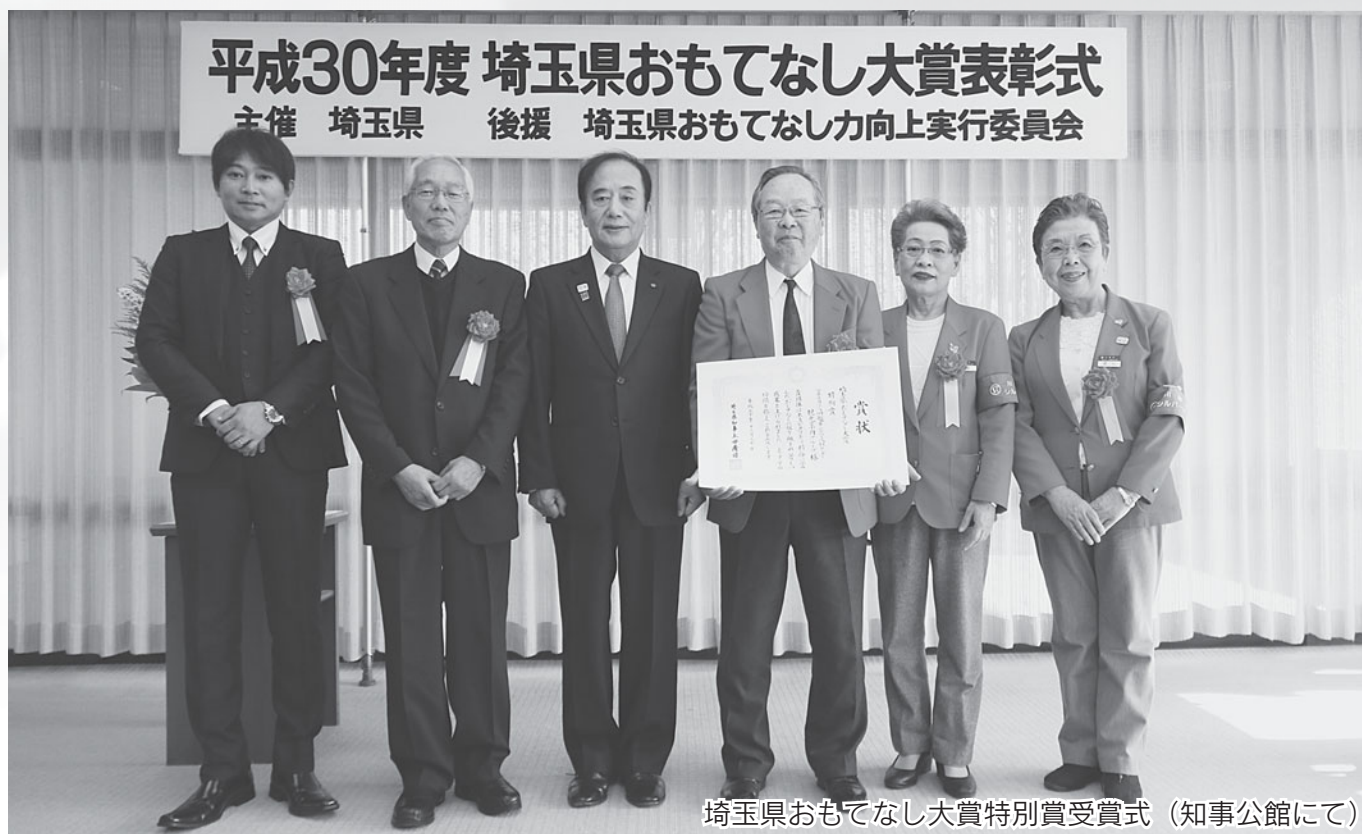
埼玉県おもてなし大賞特別賞受賞式 (知事公館にて)

公益社団法人 川越市シルバー人材センター 〒350-0824 川越市石原町2-33-13 TEL : 049 (222) 2075 FAX : 049 (222) 8973 URL : http://www.kawagoesjc.or.jp/