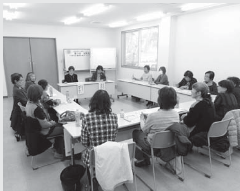
盛り上がったフリートーキング