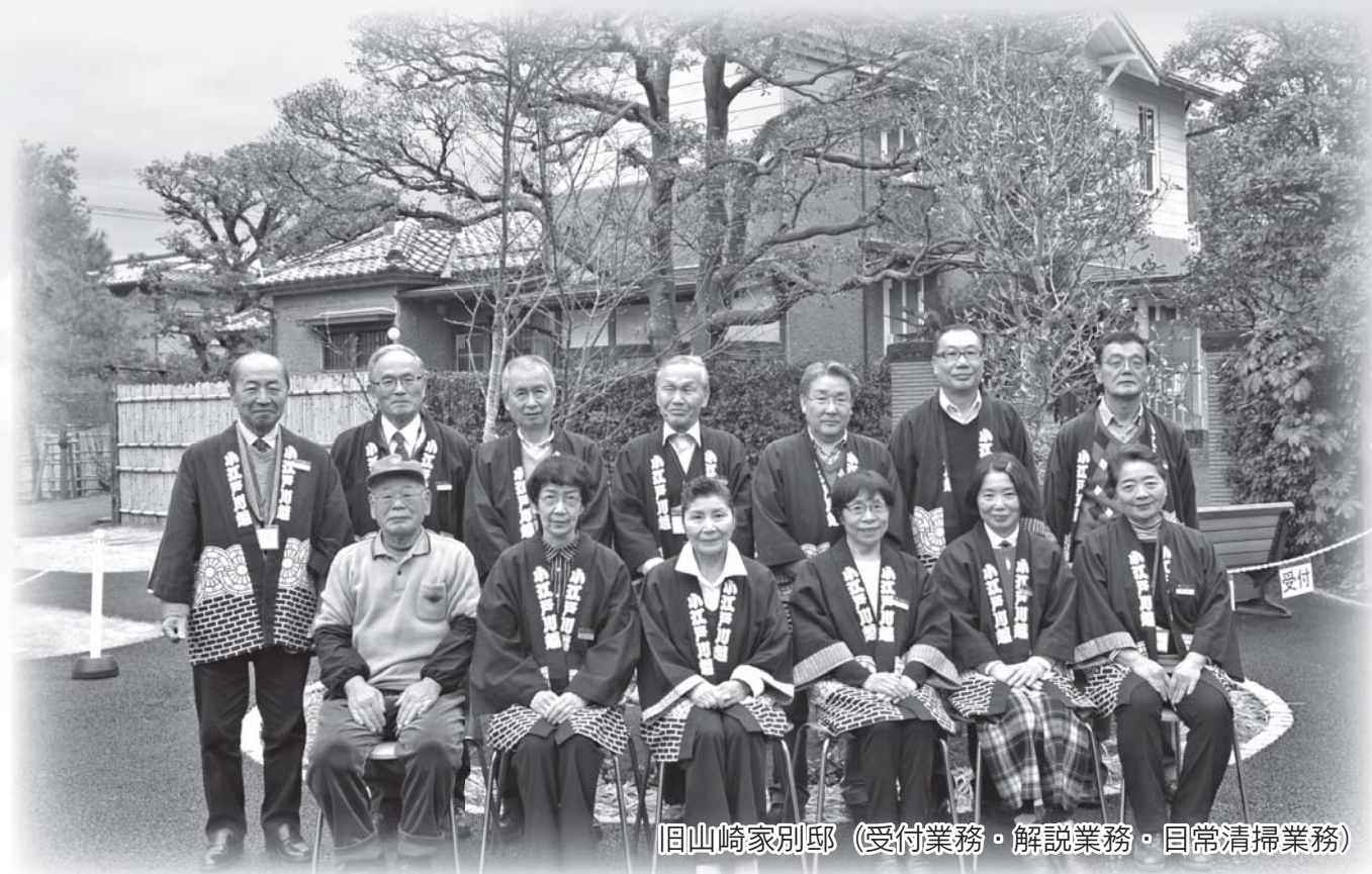
旧山崎家別邸 (受付業務・解説業務・目常清掃業務)

公益社団法人 川越市シルバー人材センター 〒350-0824 川越市石原町2-33-13 TEL : 049 (222) 2075 FAX : 049 (222) 8973 URL : http://www.kawagoesjc.or.jp/