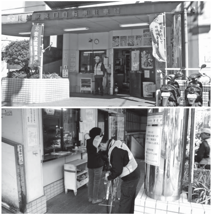
川越駅東口自転車駐車場（上下とも）