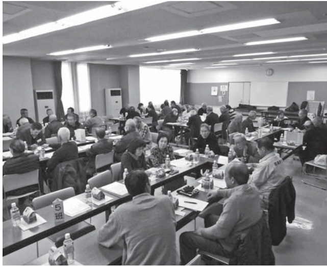
北・山田地区の地区会議