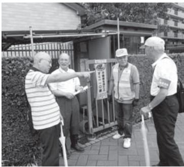
クレアパークの安全巡回