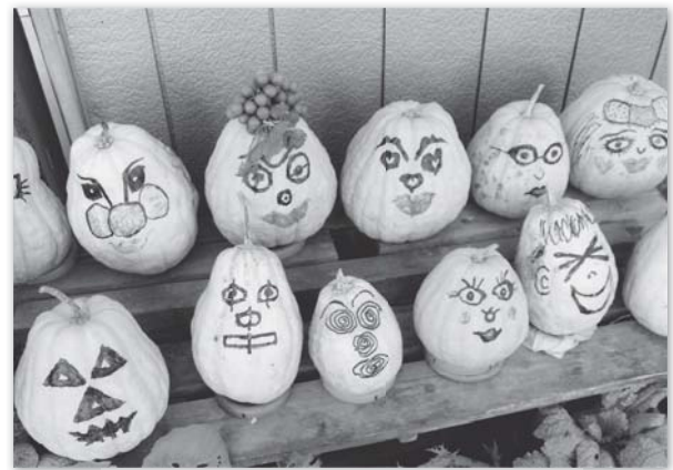
写真 〈南古谷3班〉仲野 国男