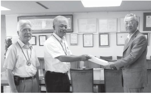
市長に支援をお願い

平成28年6月23日開催の「全シ協平成28年度定時総会」において「ニッポン一億総活躍プラン」を実践するシルバー人材センターへの支援の要望」議案が採択されました。 川越市シルバー人材センターは、平成28年8月18日に川越市長・川越市議会議長へ要請文を直接お渡しして支援をお願い致しました。