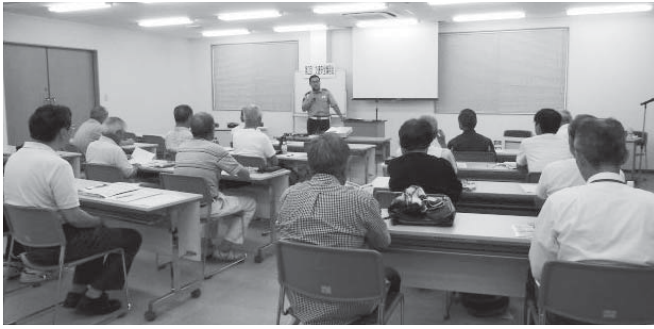
自転車の乗り方講習会