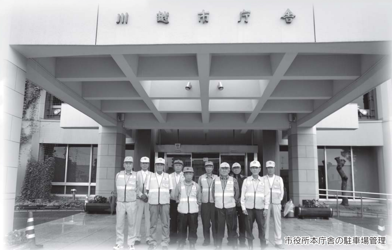
市役所本庁舎の駐車場管理

公益社団法人 川越市シルバー人材センター 〒350-0824 川越市石原町2-33-13 TEL : 049 (222) 2075 FAX : 049 (222) 8973 URL : http://www.kawagoesjc.or.jp/