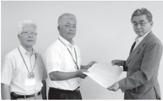
市議会議長にお願い