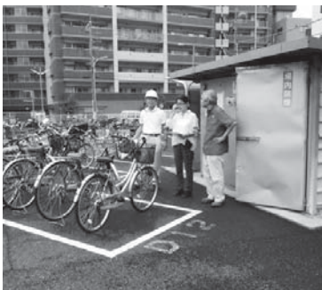
サイクルタイムズの安全巡回

○8月24日(水) 午前8時10分～午前9時 ○クレアパーク、サイクルタイムズで実施しました。 炎天下の中、いづれも適正に就業されており、頭が下がりました。熱中症、虫刺され等への注意を喚起しました。