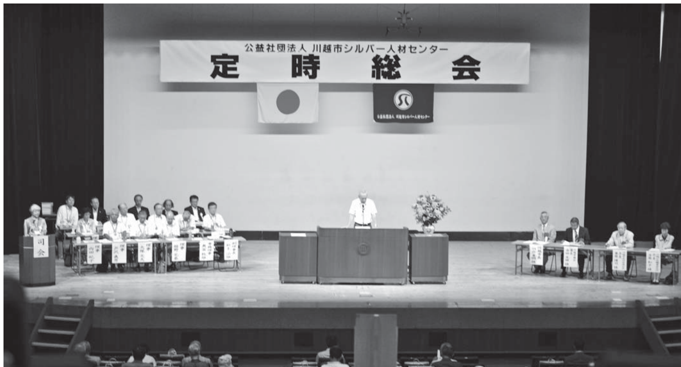
定時総会のようす