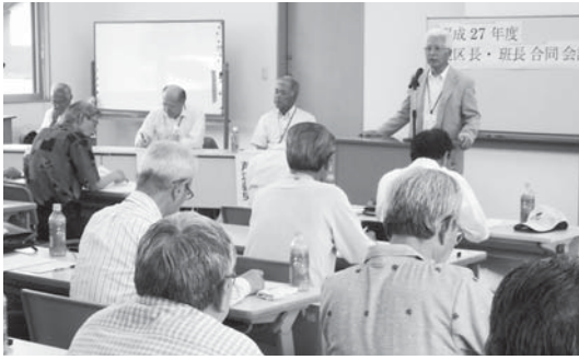
地区長・班長合同会議