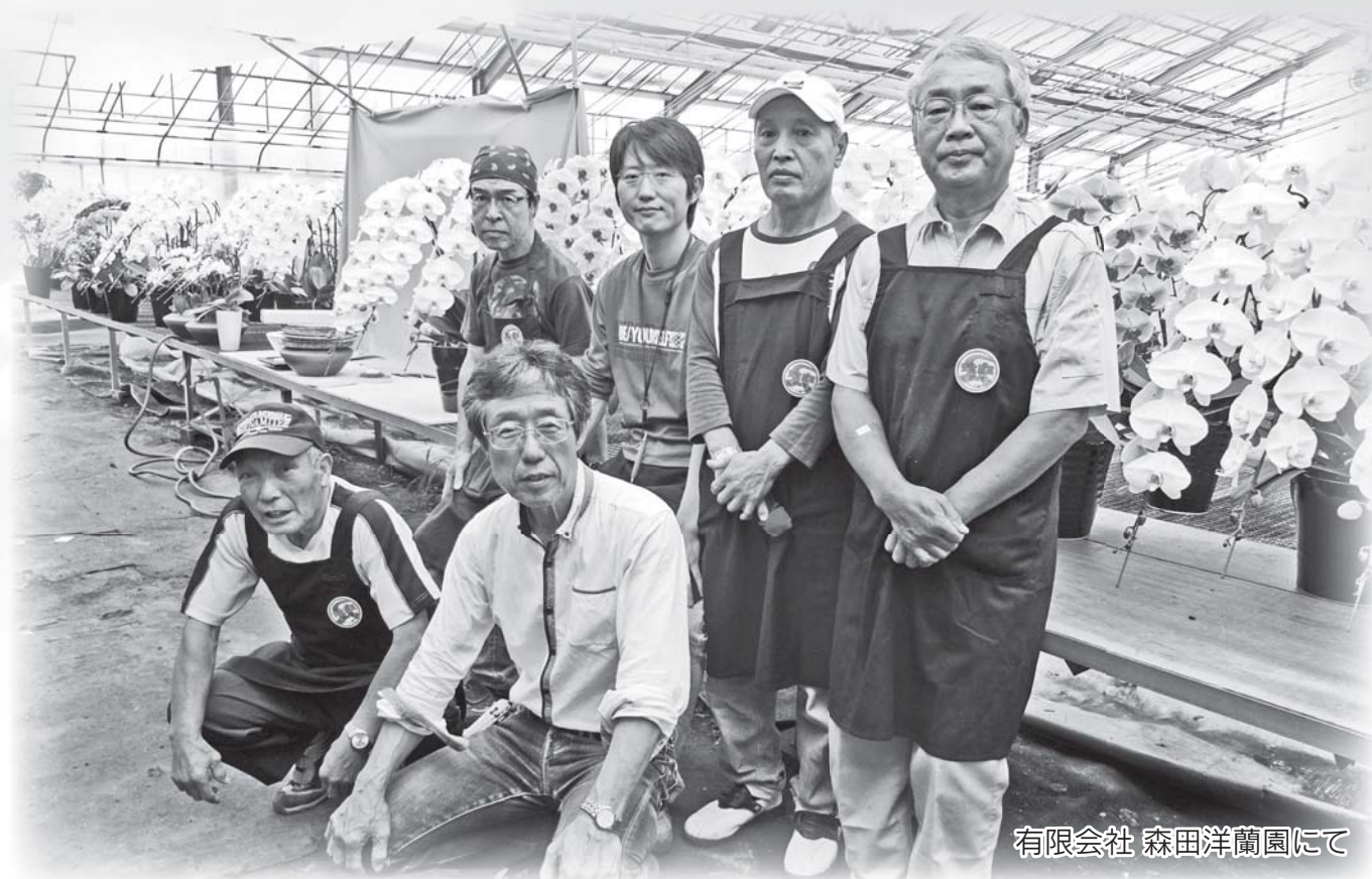
有限会社 森田洋蘭園にて

公益社団法人 川越市シルバー人材センター 〒350-0824 川越市石原町2-33-13 TEL : 049 (222) 2075 FAX : 049 (222) 8973 URL : http://www.kawagoesjc.or.jp/