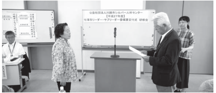
仕事別グループリーダー・サブリーダーの委嘱書交付と研修会