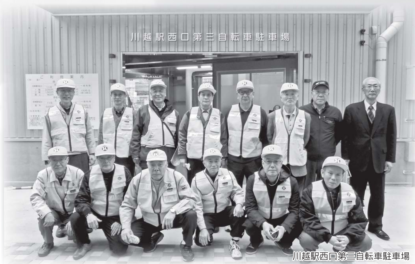
川越駅西口第三自転車駐車場

公益社団法人 川越市シルバー人材センター 〒350-0824 川越市石原町2-33-13 TEL : 049 (222) 2075 FAX : 049 (222) 8973 URL : http://www.kawagoesjc.or.jp/