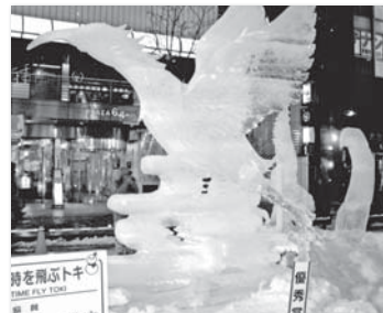
札幌雪まつり「時を飛ぶトキ」