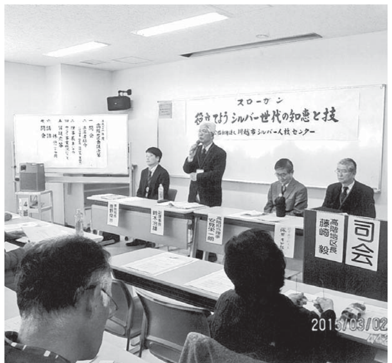
高階地区の地区会議

あわせて、3月中に各地区における班長会議を開催し、改正内容の周知と副班長候補者の「推薦書」を提出してほ