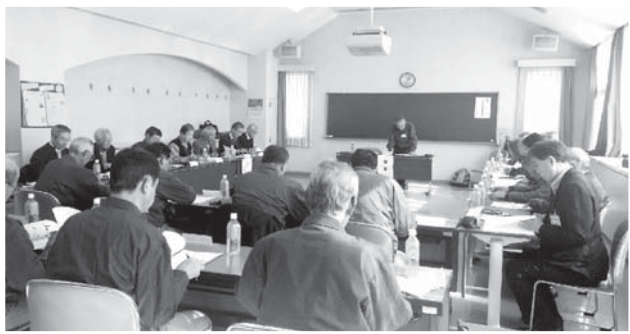
3市(坂戸市・鶴ヶ島市)合同安全対策研修会

2月27日(金)午後1時30分より鶴ヶ島市シルバー人材センターが主催して開催されま