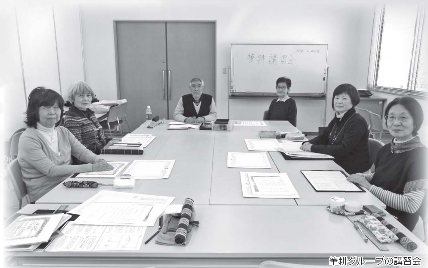
筆耕グループの講習会

公益社団法人 川越市シルバー人材センター 〒350-0824 川越市石原町2-33-13 TEL : 049 (222) 2075 FAX : 049 (222) 8973 URL : http://www.kawagoesjc.or.jp/