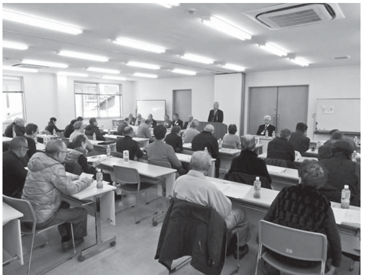
西地区の地区会議