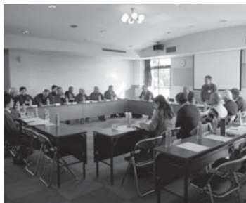
3市合同交流研修会