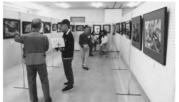
ふれあいフェスティバル2019

「ご苦労様です」という声をかけていただきました。「川越まつり」を迎えるこの時期、緑色のビブスを着用して清掃活動をする姿は、もはや恒例行事となっています。活動に参加していただいた皆さまには深く感謝いたします。来年も大勢の皆さんの参加をお待ちしております。