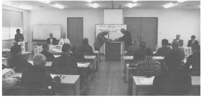
仕事別リーダー・サブリーダー研修会