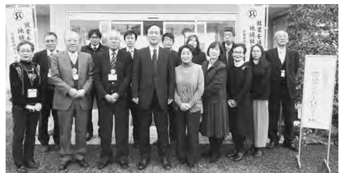
鹿児島市から来訪した視察団