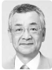
川越市長 川合善明