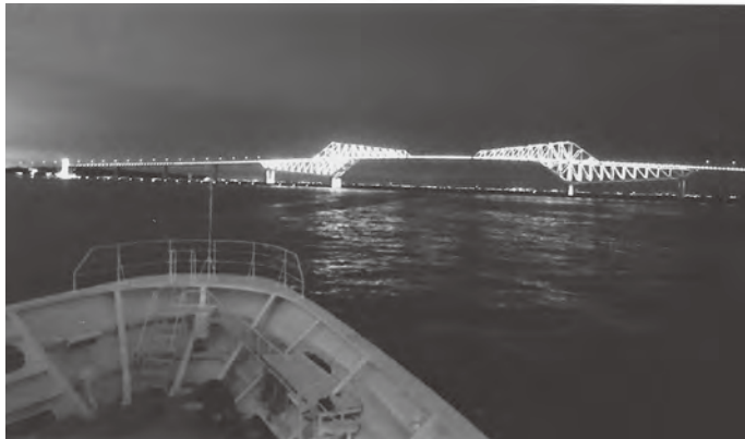
クルーズ船からの眺め (ゲートブリッジ)