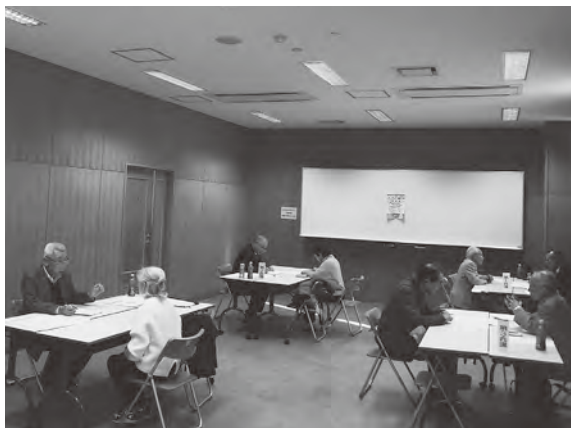
伊勢原公民館で開催された出張就業相談会

第3回「出張就業相談会」が12月16日（月）伊勢原公民館で開催されました。霞ヶ関・名細地区の就業率のアップと就業ニーズのマッチングを課題とし、地区長・班長さんのご支援とご協力により盛会裏に相談会が行われ、今回の相談者数は、25名（男性20名・女性5名）でした。そのうち7名の方が当日就業申