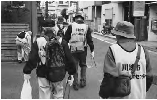
清掃ボランティア

「ちょうど、入会しようと思っていたので」と言つてパンフレットを嬉しそうに受け取つてくれたご婦人。差し出しても知らん振りして通り過ぎる人。「俺、会員なんだよ」など。11月23日・24日、ウエスタ川越の広場でパンフレット