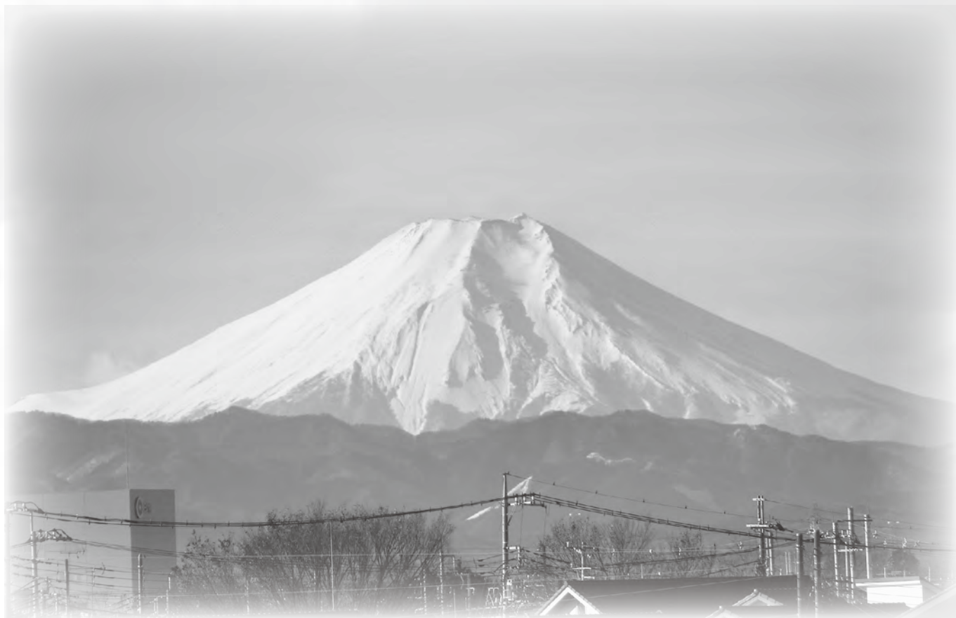
富士山 (かわごえ橋より)

公益社団法人 川越市シルバー人材センター 〒350-0824 川越市石原町2-33-13 TEL : 049 (222) 2075 FAX : 049 (222) 8973 URL : https://webc.sjc.ne.jp/kawagoe/