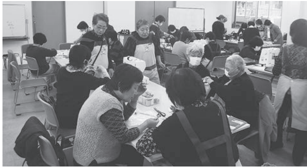
十若会の袋の製作