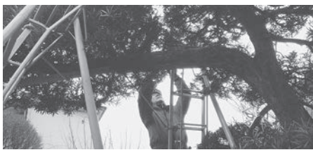
植木剪定作業の安全巡回

実施結果 植木剪定作業では、各班とも作業前に事故防止上のポイント・作業用具類の機能点検等を確実に実施し、事故ゼロに向けて真剣に取り組んでいました。 （安全委員会 一瀬）