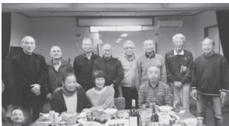
ボウリング同好会