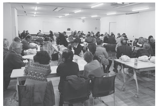
南地区の班別会議

会報123号（10月15日発行）でも周知したが、「接客の際の言葉遣いや態度」、「就業日の失念」等のクレームが多いので、十分注意してほしい。