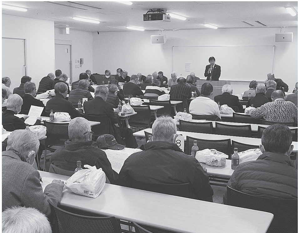
南地区の地区会議

令和元年度の地区会議が各地区において開催されました。地区会議は、2月6日の南古谷地区を皮切りに、2月25日の高階地区を最後に、11地区すべてにおいて終了しました。 参加会員数は、対象会員2422人のうち621人（参加率25・6%）でした。