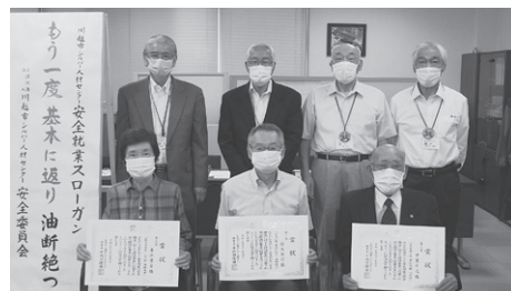
安全就業標語の表彰式

川越市シルバー人材センターの安全標語が左記の通り決定しました。標語を実践し、安全就業に努めましょう。