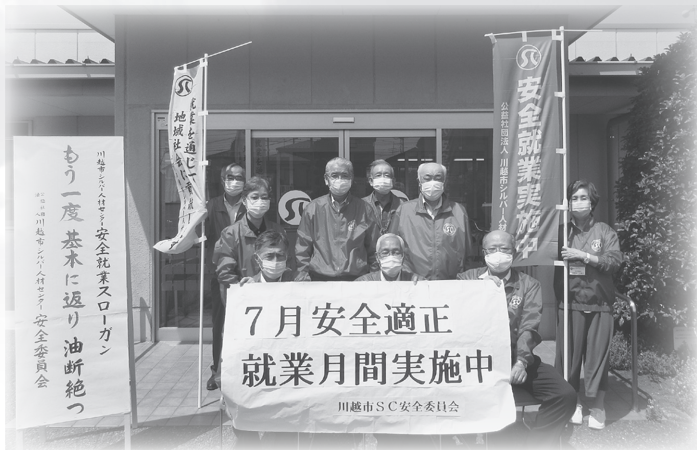
事故ゼロを目指す安全委員会

公益社団法人 川越市シルバー人材センター 〒350-0824 川越市石原町2-33-13 TEL : 049 (222) 2075 FAX : 049 (222) 8973 URL : https://webc.sjc.ne.jp/kawagoe/index