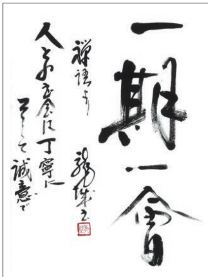
▲高階8班 藤崎 毅