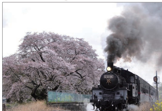
満開の桜とSL 栃木県内真岡鉄道 ▲高階9班 阿曾 富雄