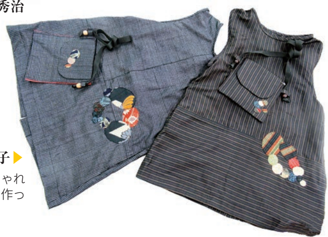
大東5班 石崎 重子▶ 祖母の形見の着物でおしゃれ エプロンとポシェットを作っ てみました