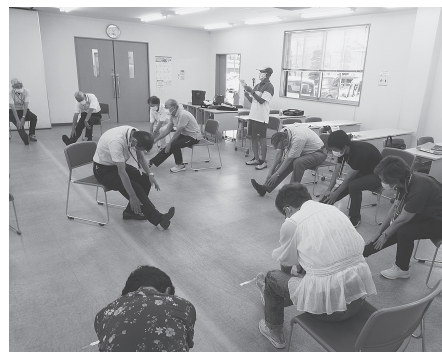
フレイル予防サポーター資格授与式と模擬研修風景