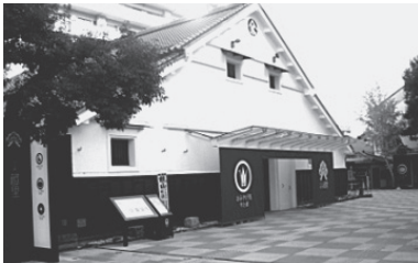
出品物はイメージです