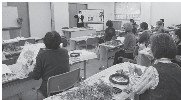
写真はハーブでクリスマス飾り (2020年)

日時 12月13日(火) 午前10時～正午 会場 センター会議室 定員 20名 申し込み 10月20日(木)～定員になり次第 お電話もしくは直接事務局まで 平日 午前8時半～午後5時15分 持ち物 園芸ばさみ