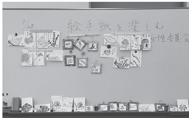
写真は絵手紙体験第1弾における作品

筆や水彩絵の具はこちらで用意いたしますが、ご自身の物を持ってきていただいても大丈夫です。