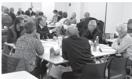
南地区 分科会風景