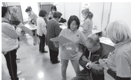
南古谷地区 体力測定風景