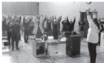
名細地区 お腹元気教室風景