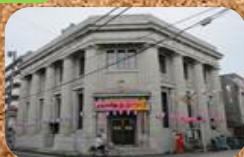
商工会議所(旧武州銀行)