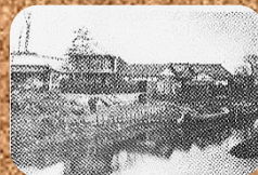
上新河岸(大正初期)