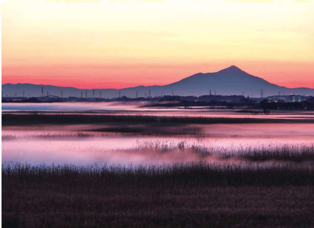
「渡良瀬遊水地(ラムサール条約登録湿地)から望む筑波山」

加須市礼羽63 TEL 0480-62-6490 FAX 0480-62-1140 ホームページ http://www.kazo-sc.or.jp/