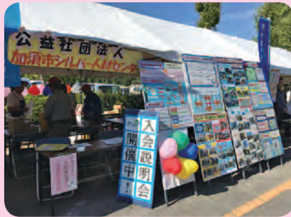
加須地域市民まつり