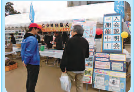
第6回童謡のふる里おとね市民まつり