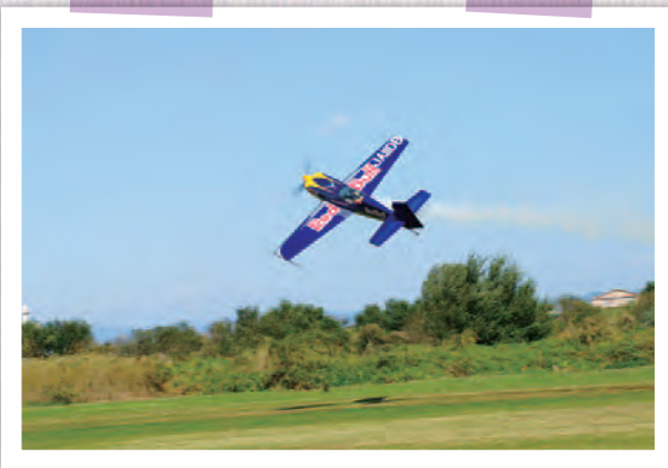
「青空に(写真)」中村 政治 会員