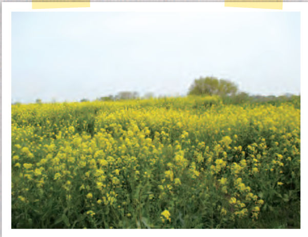
「春のひろがり(写真)」長沼 荘一 会員