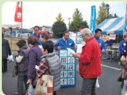
北川辺ふるさと秋まつり