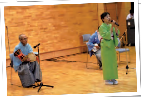
若岑緑奈民謡ショー