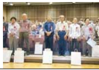
会員永年表彰(20年 15年 10年)