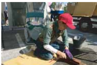
刃物研ぎ無料サービス