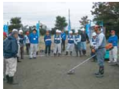
草刈機取扱講習会

平成26年度は高齢者交通安全講習を2回、清掃作業研修会、草刈機取扱講習会を実施し、安全意識や作業の知識を高めました。