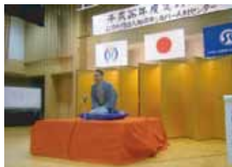
アトラクション 落語