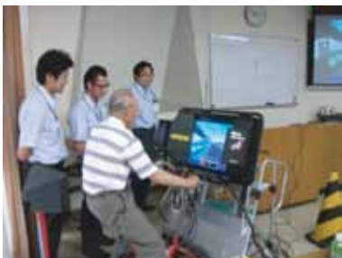
高齢者交通安全講習会