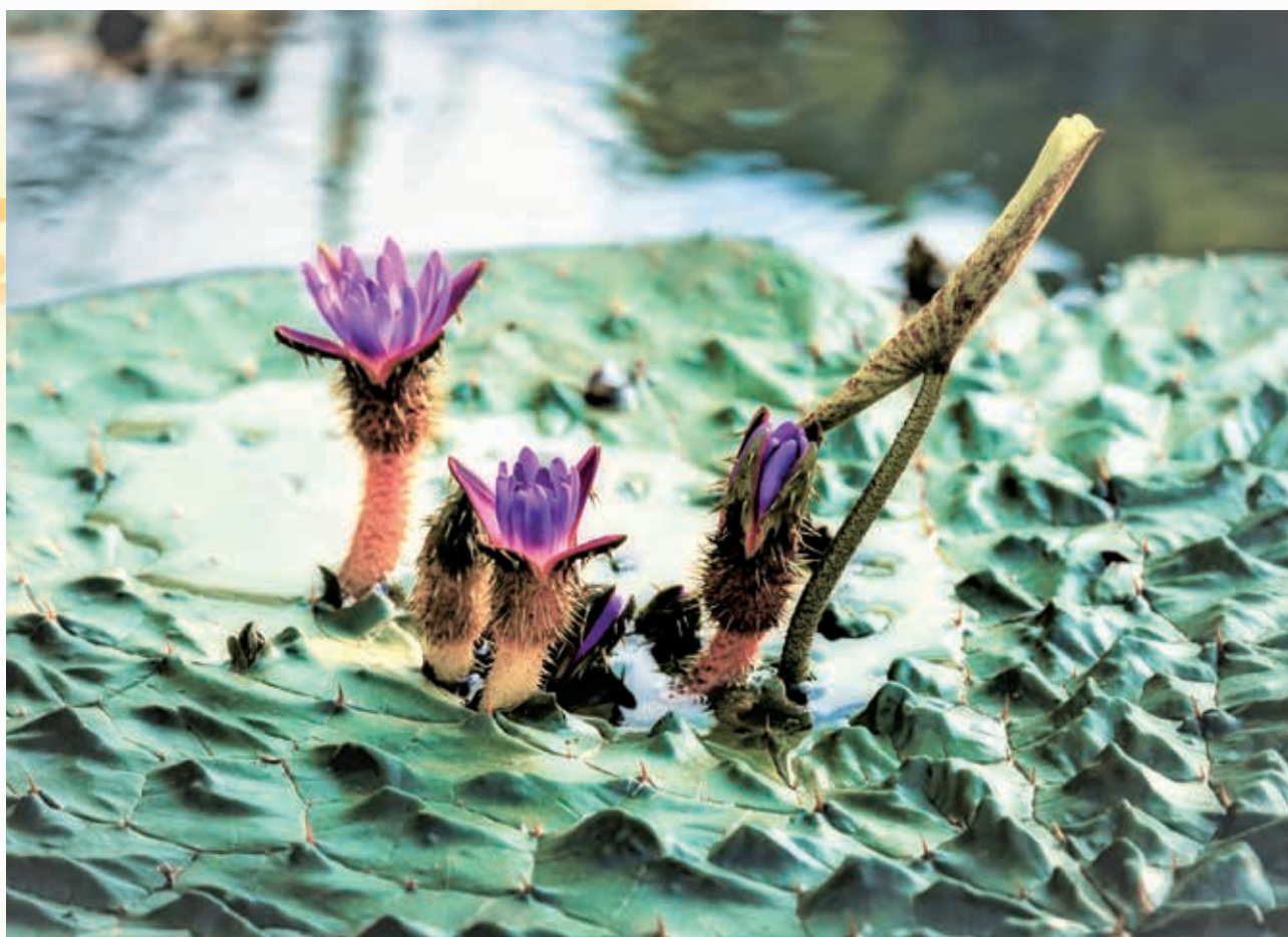
「咲き誇る悠久の郷土花(オニバス)」

加須市礼羽63 TEL 0480-62-6490 FAX 0480-62-1140 ホームページ http://www.kazo-sc.or.jp/