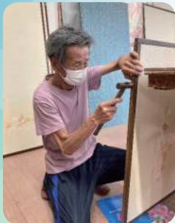
襖(ふすま)の張替え、調整