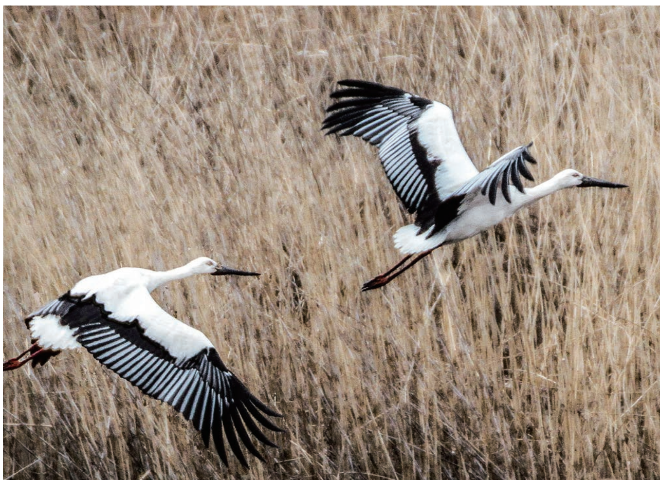
「幸せを呼ぶ来訪者(コウノトリ)」 撮影場所：渡良瀬遊水地

加須市礼羽63 TEL 0480-62-6490 FAX 0480-62-1140 ホームページ http://www.kazo-sc.or.jp/