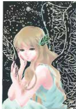
スクラッチアートの会 (7月開催)