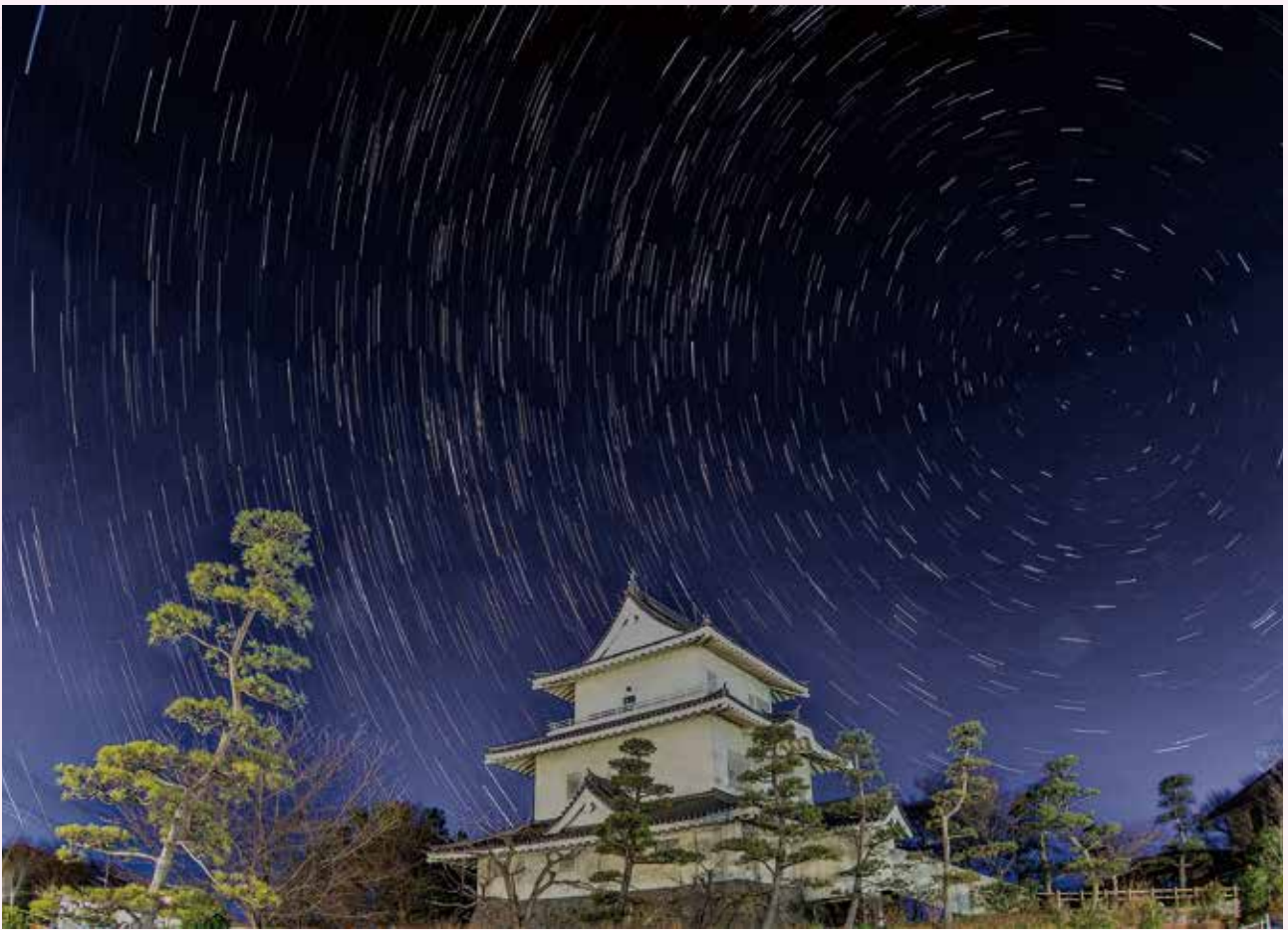
「騎西城 天空への誘い」 いざな 撮影場所：騎西城

加須市礼羽63 TEL 0480-62-6490 FAX 0480-62-1140 ホームページ https://webc.sjc.ne.jp/kazo/