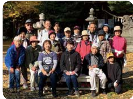
市内ウォーキング (11月開催)