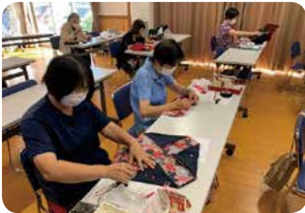
かんたんアクセサリー& 巾着袋づくり (9月開催)