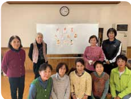
年賀状教室 (12月開催)