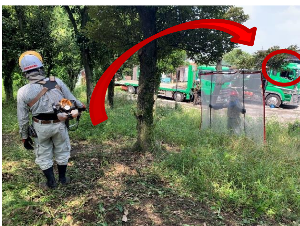
【草刈機の飛石による破損】防石ネットを飛び越え、車の窓ガラスを破損。