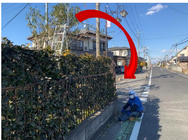
【脚立からの転落】三脚が倒れ、道路に転落。