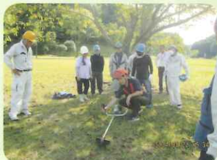
【技能講習／刈払機取扱安全講習】