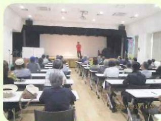
【周知・広報／シルバー応援大使講演】