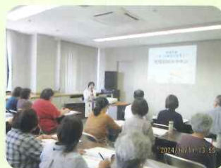
【周知・広報／整理収納セミナー】