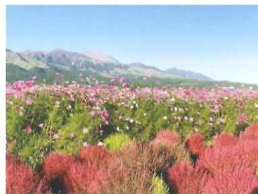
道の駅からの展望「阿蘇五岳とコスモス・コキア」