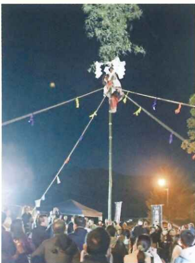
文化庁選択無形文化財「長野岩戸神楽・てんのうしめ」

当シルバー人材センターは、平成19年に設立され、現在の会員登録数は40名で、主に農地や宅地等の草刈り・村内の施設の清掃などの依頼に対応しています。令和4年度、令和5年度には会員拡大率1位・2位となりましたが、まだまだ会員不足の為、村の広報誌などで周知をおこなっています。今後も地域の方々に喜ばれるようスキルの上を図りながら、会員が安全で充実した活動がおこなえる様工夫していきたいと思えます。