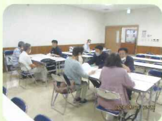
【周知・広報／就業相談会】