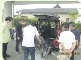
【技能講習／福祉有償運送講習】