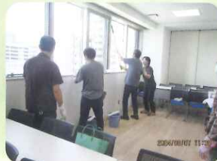
【技能講習／ハウスクリーニング講習】