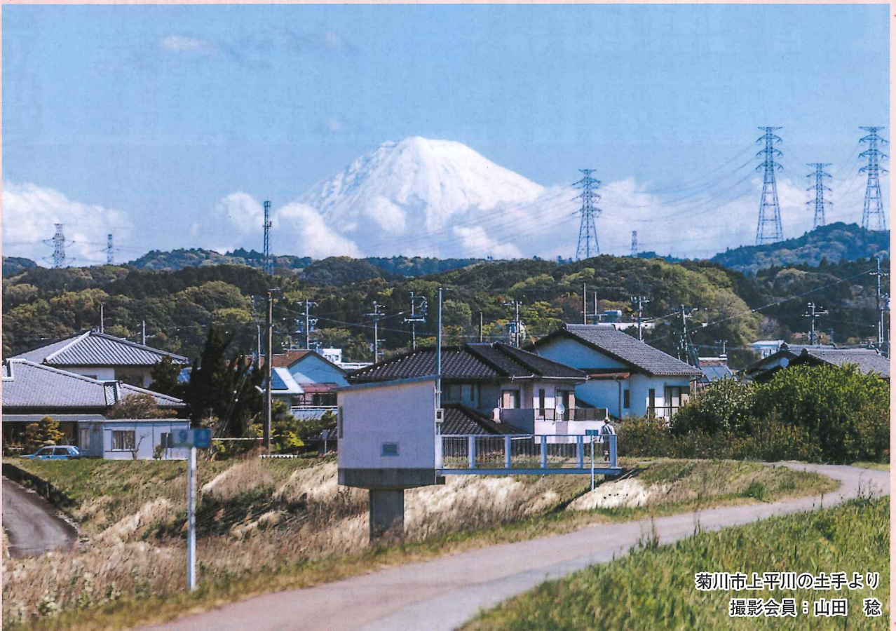
菊川市上平川の土手より