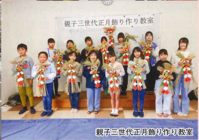
親子三世代正月飾り作り教室