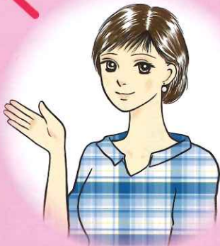
イラスト：落合江美