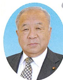
君津市議会議長 鈴木 良次