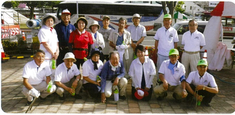
(石井市長を囲んで集合写真)

今年も、君津市民ふれあい祭り翌日の 8 月 5 日に君津駅南口ロータリー付近で、ゴミ拾いのボランティア作業を実施しました。参加されました会員の皆さん、暑い中大変お疲れ様でした。今後も、ご協力よろしくお願いたします。