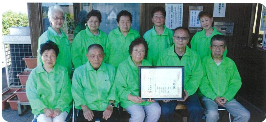
(就業している会員の皆さん)

老人憩いの家すえよし（市からの指定管理者施設）が、防火管理体制の強化と火災予防の普及向上に尽力したとして、君津市防火安全協会より、令和2年5月8日に表彰されました。