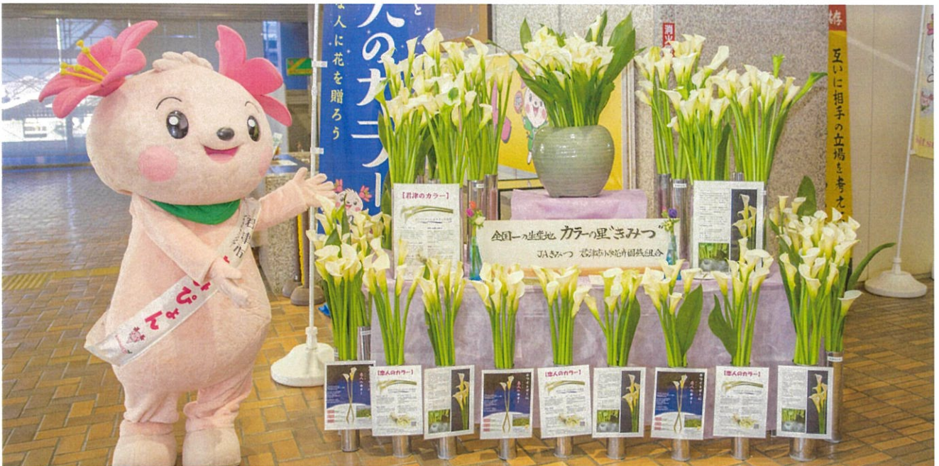
日本一の生産量を誇る君津のカラーは、90%以上が豊かな自然環境に恵まれた小糸地区で栽培されています