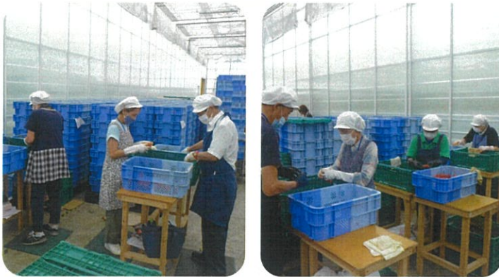
(トマトの選別の就業をしている会員の皆さん)

会員一人ひとりが、安全就業基準を遵守し、無事故・無災害に取組み適正な就業及び事故防止に万全を期していただきますようお願いいたします。