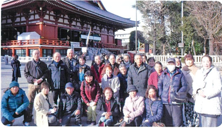
(浅草寺での集合写真)